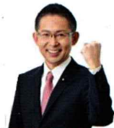
前 総務大臣政務官 衆議院議員